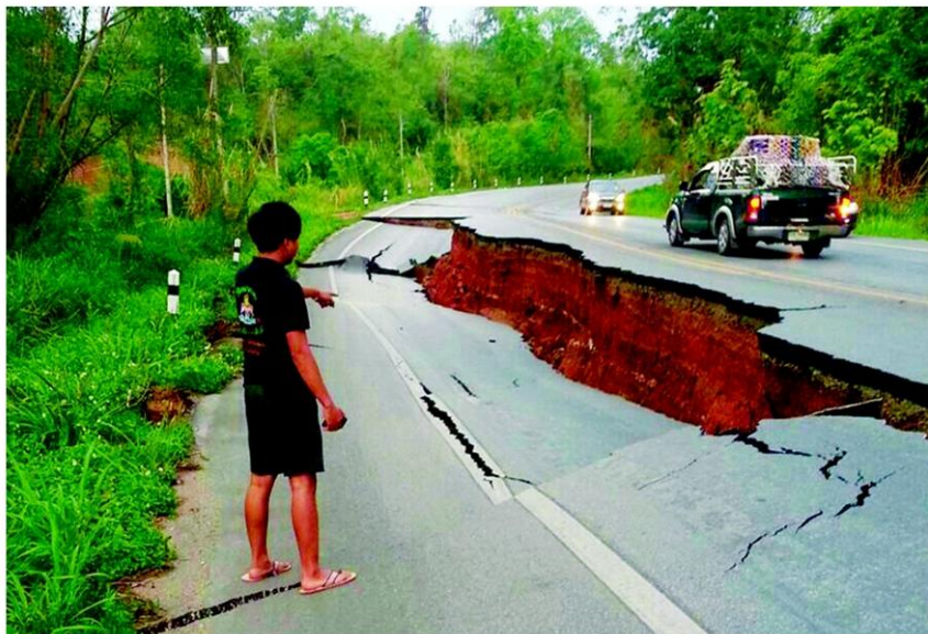
ถนนแยก - ถนนสาย 118 เชียงราย-แม่สรวย-เชียงใหม่ แตกร้าวและทรุดเป็นหลุมหลายจุดตลอดเส้นทาง หลังเกิดเหตุการณ์แผ่นดินไหวขนาด 6.3 ริกเตอร์ ซึ่งมีควมรุนแรงมากที่สุดในประเทศไทย เมื่อวันที่ 5 พ.ค.

หลังจากเมื่อประมาณเวลา 18.08 น.วันที่ 5 พ.ค. 2557 ได้เกิดเหตุแผ่นดินไหว ขนาดประมาณ 6.3 ริกเตอร์มีศูนย์กลางอยู่ที่ ต.แม่ฮ้อย