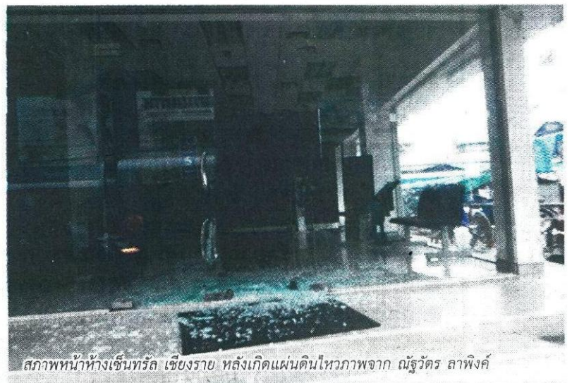
สภาพหน้าห้างเซ็นทรัล เชียงราย หลังเกิดแผ่นดินไหว