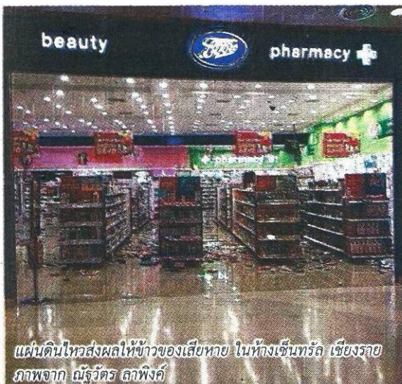
แผ่นดินไหวส่งผลให้ข้าวของเสียหาย ในห้างเซ็นทรัล เชียงราย