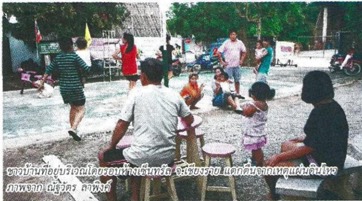
ชาวบ้านที่อยู่บริเวณโดยรอบห้างเซ็นทรัล จ.เชียงราย แยกดินจากแผ่นดินไหว