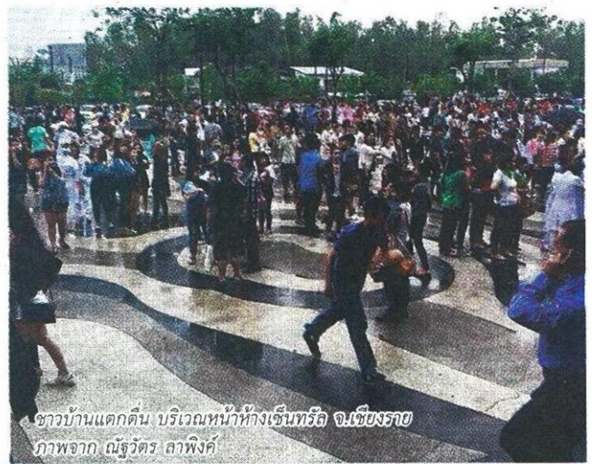
ชาวบ้านแตกตื่น บริเวณหน้าห้างเซ็นทรัล จ.เชียงราย