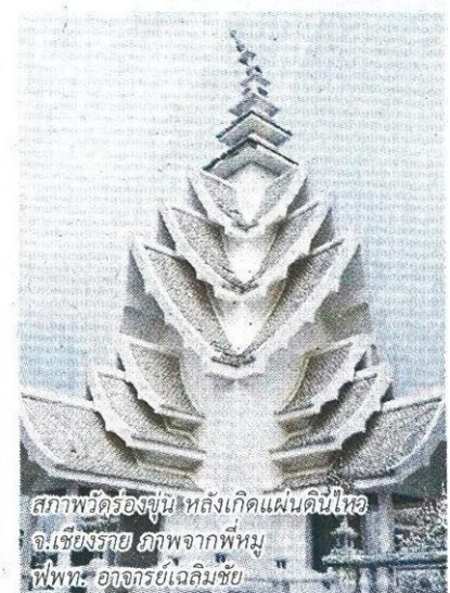
สภาพวัดร่องจุ่น หลังเกิดแผ่นดินไหว จ.เชียงราย