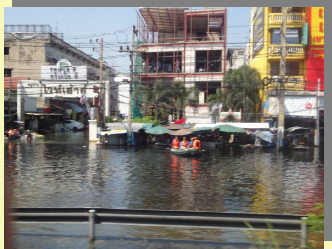
สายน้ำกระจายขณะรถ ยี่เอ็มซี วิ่ง