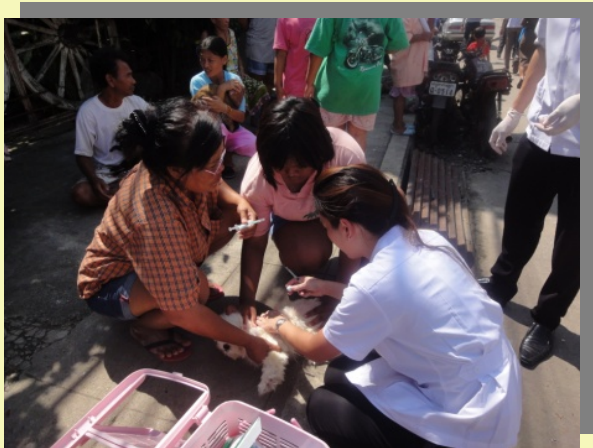
สัตวแพทย์ กรำทั้งแดดและฝน รักษาตามคลินิกไม่มีอย่างนี้ครับ จะบอกให้

ไปถึงปั๊มน้ำมันก็ทำงานทันที อ้อ เรามากัน 4 หมอ คือ จากจุฬาฯ 2 และจากเกษตร 2 (หมอมงคลศักดิ์ และอีกคนจำ ชื่อไม่ได้) หมอหญิงหนึ่งและหมอชายสาม