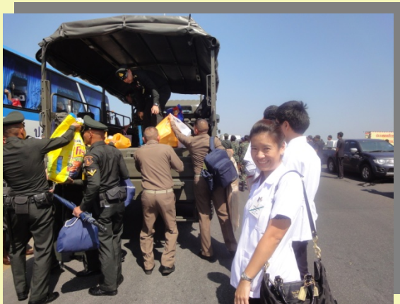
ซักรูปเสียหน่อย ก่อนจันทน์รถ ยี่เอ็มซี

ออกเดินทางจากวังสกุญชัยราว 10 โมง นิ่งรถ รยล. ฟุ้งตรงจันทน์ทางด่วนยมราช ไปต่อโทลล์เวย์ รวดเร็วดีศรีขุมพอจันทน์เห็นรถชนต้นน้ำน้ำจืดกันเพียบ เต็มทางจันทน์โทลล์เวย์ ๓๐รถ ยี่เอ็มซี ของทหาร รถวิ่งฝ่าน้ำไป ละอองน้ำ (เฝ้า) กระเด็นใส่หน้าเป็นระยะ ๆ ส่งสารนมอเตช ส่งสับสี่จะจันทน์อีกหลายเม็ด