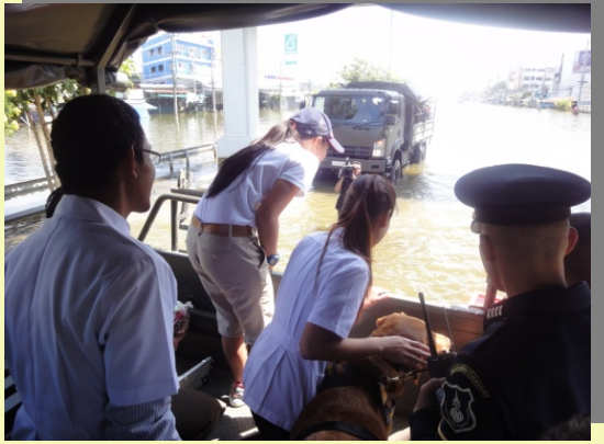
ขณะวิ่งรถผ่าน หากเห็นสุนัขพร้อมคน จะทวงเรียกเข้ามารับอาหารทั้งคนและสุนัข