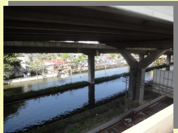
ถ้ำถนนวนิวาถ์วังสิต ขาออกจากมมสูงโทลล์เวย์

บางแห่งที่ท่วมแล้วก็เลิกท่วม เช่น หน้าตลาดไท บางแห่งเช่นหน้า ม. ธรรมศาสตร์ และ ม. กุรุงเทพฯ ยังท่วมอยู่ กลิ่นน้ำเน่าโชยมา พร้อมกับขยะจำนวนมากบนถนน กว่าเจ็ดถึงอยุธยาที่เกือบเที่ยง