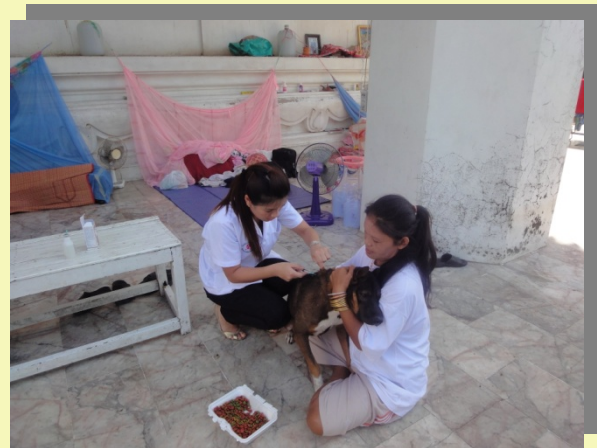
รักษาสุนัขป่วย จัดไอโวนเม็กทิน ที่วัดมงคลบพิตร