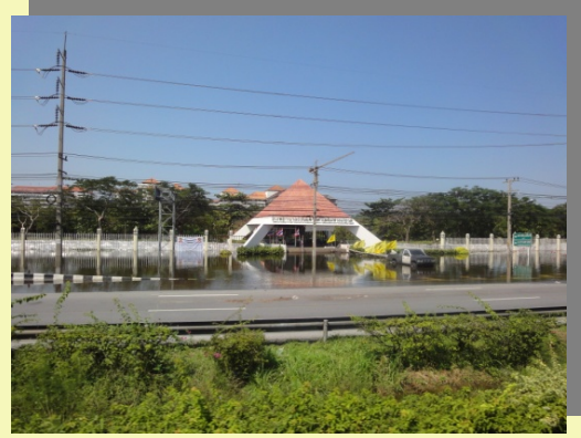
หน้า ม. เกษฏศาสตร์ และ ม. ธรรมศาสตร์