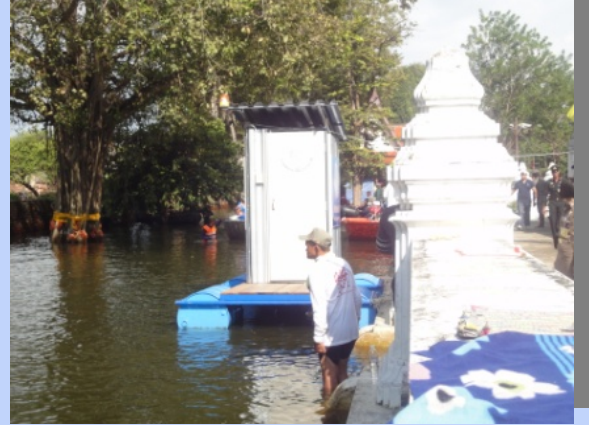
สุทธานายน้ำของกระทรวงแรงงาน อยู่ถ้ำน้ำค้างกำแพงโบสถ์ ถ้ำน้ำติดกับพระราชวังโบราณ ขามน้ำไม่ท่วม ชาติไม่ได้ในะครบ