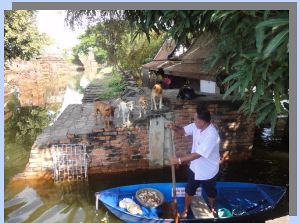
ฝูงสุนัขที่รอดชีวิต อยู่รอบพระราชวังโบราณ วัดมณฑลปพิตร