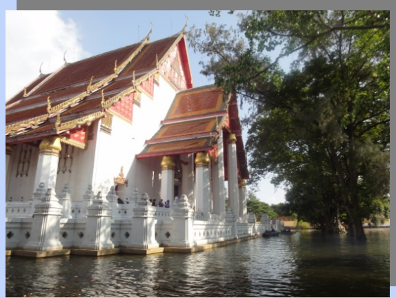
ภาพด้านหลังโบสถ์