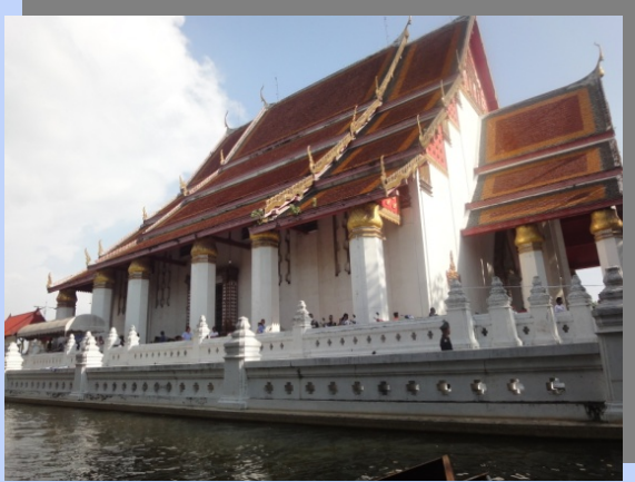
ภาพด้านข้างโบสถ์