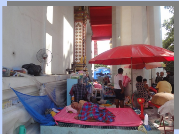
สถานที่พักพิงทั้งคนและสัตว์รอบโบสถ์ขามน้ำท่วม