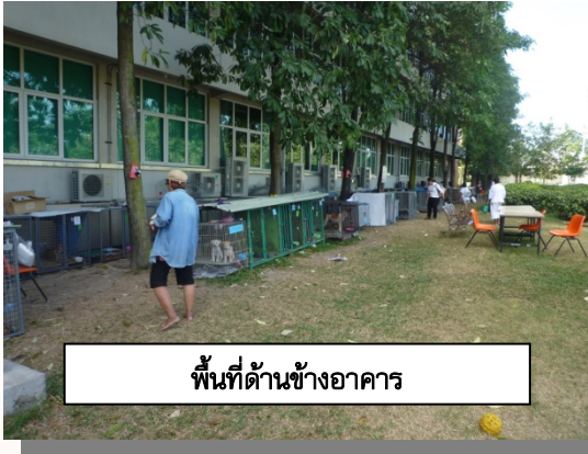
พื้นที่ด้านข้างอาคาร