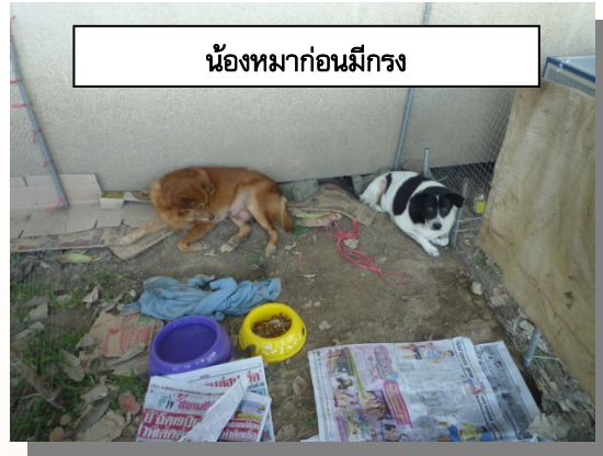
น้องหมาก่อนมีกรง